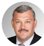
Сергей Гапликов Глава Республики Коми

Мы первыми в России начали выплачивать региональный семейный капитал при рождении первенца. Это 150 тысяч рублей из республиканского бюджета, которые станут хорошей поддержкой для молодых семей.